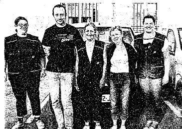
Les voitures jaunes ne stationnent plus sur la place du colonel Parisot ; les facteurs sont désormais à Nogaro.

Les élus et les Aignannais qui ont soutenu les facteurs dans cette bataille pour conserver le tri à Aignan déplorent cet éloignement car la Poste, ce sont des hommes et des femmes qui faisaient leurs achats à Aignan et qui désormais les feront à Nogaro ; ce sont aussi des salariés qui vont rajouter des kilomètres à leurs compteurs et qui vont passer d'une ambiance familiale et amicale à de nou-