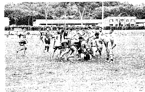
Les Risclais l'emportent sans avoir entièrement convaincu.

Pour l'équipe I, ce fut plus compliqué. Une bonne discipline, durant 10 minutes, puis les « bleu et blanc » sont dominés jusqu'à