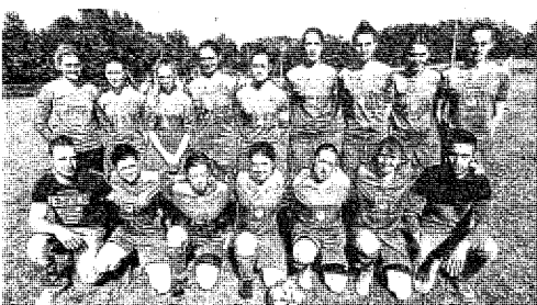
Les féminines de Manciet débutent bien leur championnat.