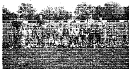
Le rassemblement U 6 et U 7 à Jü-Belloc.