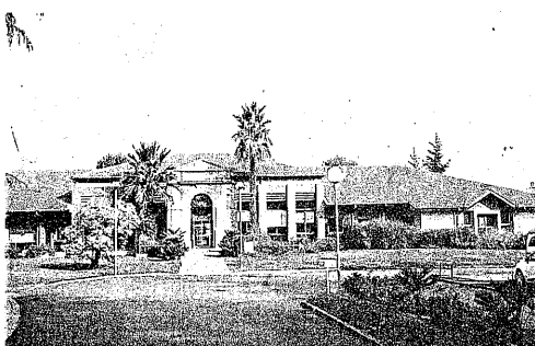
Le centre Jean-Sarrailh à Aire-sur-l'Adour.