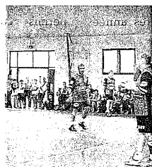
Coteaux de Gascogne Handball attaque.

L'équipe de handball Coteaux de Gascogne jouait, ce dimanche, face à Lourdes, en championnat régional. Les moins de 15 ans n'ont pu sortir vainqueurs de leur rencontre, l'équipe ne comptait que 9 joueurs face aux 11 handballeurs adverses. Dimanche 12, ils se rendront à Lombez-Samatan II.